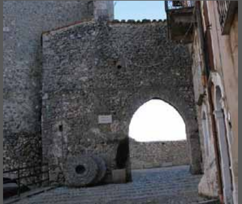
(1) CHIESA DI S. MARCO EVANGELISTA

La Chiesa della Madonna del Suffragio, della prima metà del XV secolo, era la sede della "Compagnia delle Anime del Suffragio", fondata nel 1685. La struttura ha una vasta sala rettangolare a navata unica che prosegue in un'ampia sacrestia, sovrastata dall'oratorio. Il campanile è stato aggiunto al corpo centrale nel 1834 e le campane nel 1837. L'interno è caratterizzato da una decorazione in stucco di epoca barocca che orna le cornici delle finestre e gli archi che si aprono lungo le pareti dell'edificio. L'altare maggiore, in legno scolpito e dorato, è uno degli esempi più rilevanti di manifattura lignea dell'intera regione. In alto, all'interno di una nicchia, si conserva un'antica statua della Vergine, vestita con il tipico costume castellano. Splendidi sono anche gli altari laterali, tutti ricoperti in oro zecchino.