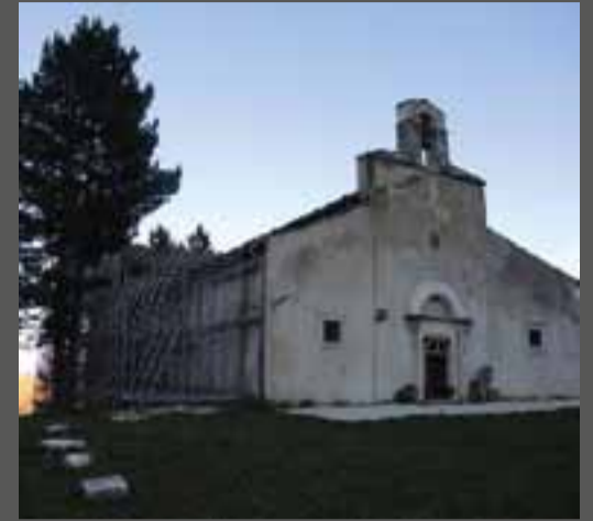
(1) ABBZIA DI SANTA LUCIA

Si tratta della chiesa storica più importante di Rocca, al livello artistico. Si trova appena fuori il paese, eretta nell'XI secolo. Fino al 1703 aveva vissuto un florido periodo, come dimostrano anche i ricchi affreschi voluti dalle ricche famiglie che dominavano il borgo. Dopo il terremoto gran parte del monastero andò distrutto e la chiesa divenne un semplice tempio campestre, fino alla "riscoperta" culturale nel XX secolo. Il terremoto del 2009 ha lesionato parte del fianco a destra e alcuni affreschi interni. La chiesa attuale si presenta nel restauro avvenuto dopo il 1703, con una facciata a capanna con tardo portale romanico del XV secolo, e una piccola finestra circolare. Il campanile centrale a vela è del Novecento. La pianta conserva ancora la caratteristica originale della chiesa fortezza a pianta basilicale, a tre navate, con leggeri contrafforti laterali, e con i bracci sporgenti del transetto.